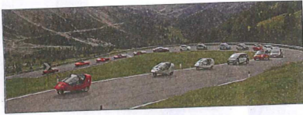
40 è i mesi eletrics che à tut pert ala roda incèr le Sela.

Garatada la cuarta roda incèr i jus dl Sela cun i auti eletrics y incè le Sellaronda Bike Day, che à albi en chësta secunda ediziun da en chësc ann incèr 3.500 partezipanè