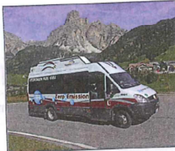
Ala cuarta ediziun de ECOdolomites à tut pert incè n minibus a idrogenn.